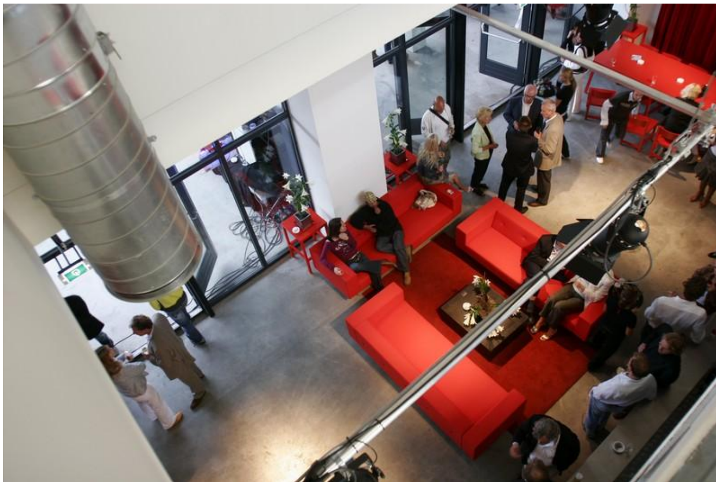
MDC toekomst debat 29 november 2007